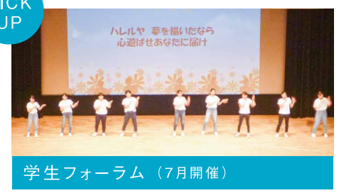
学生フォーラム (7月開催)

学校・学年の垣根を越え、看護を考え、交流する1日。日頃の学校生活で培った主体性を発揮し、企画・運営します。