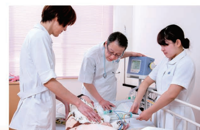
慢性呼吸器疾患看護認定看護師によるベッドサイドでの人工呼吸器指導