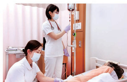
血液疾患患者への治療場面