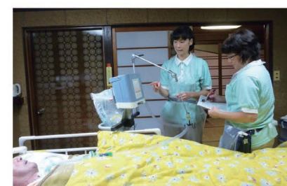
在宅での人工呼吸器管理