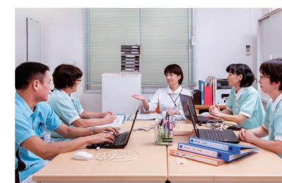
訪問診療医師とのカンファレンス