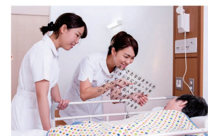
文字盤を活用して患者のわずかな動きから訴えや思いを感じ取る