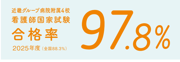
【国立病院機構(近畿)看護師国家試験合格率】

着実に知識と技術が身につく教育で、看護師国家試験では、毎年全国を超える高い合格率を誇っています。